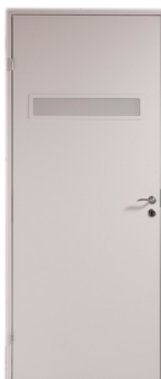
Slät vit med glas

Kika närmare på bilderna! www.bengtssonssnickeri.se